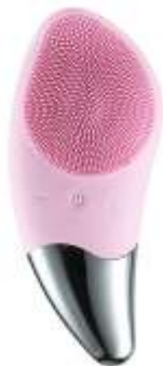
Szónikus arctisztító kefe